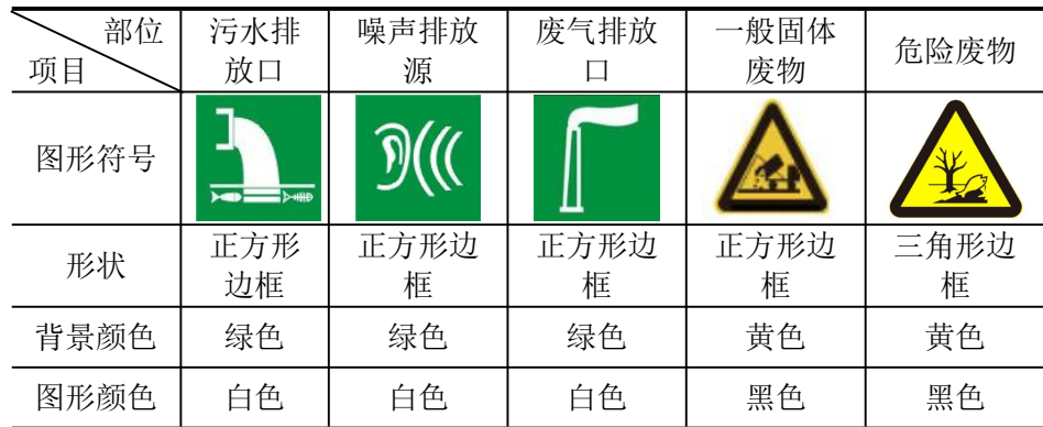
表 5-2 各排污口（源）标志牌设置示意图