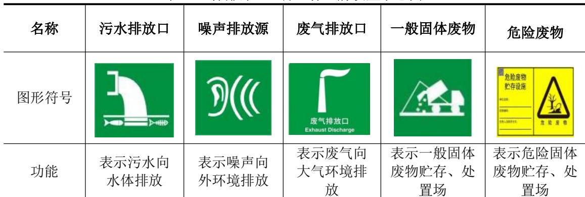
表 5-2 各排污口(源)标志牌设置示意图

③排放口规范化管理：各污染源排放口应设置专项图标，执行建设项目应完成排污口规范建设，投资应纳入正常生产设备之中。各污染源排放口应设置专项图标，执行《环境图形标准 排污口(源)》(GB 15563.1-1995)、《环境保护图形标志 固体废物贮存(处置)场》(GB15562.2-1995)及其修改单、《危险废物识别标志设置技术规范》(HJ1276-2022)、《排污单位污染物排放口二维码标识 技术规范》(HJ 1297-2023)及《关于印发排放口标志牌技术规格的通知》(环办〔2003〕95号，国家环保总局办公厅)，要求各排污口(源)提示标志形状采用正方形边框，背景颜色、图形颜色根据下表确定。标志牌应设在与之功能相应的醒目处，并保持清晰、完整，详见下表：